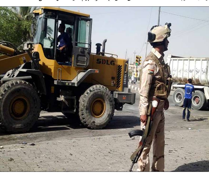
قوات الأمن 115 شخصا.

قالت نيويورك تايمز إن التفجيرات وقعت رغم تشديد إجراءات الأمن، وإنها زادت المخاوف من أن أعمال العنف الطائفي الذي شهدته العراق عامي 2006 و2007. وأوضحت أن الجيش العراقي بدأ عمليات ضد تنظيم القاعدة في بلاد الرافدين والمجموعات الأخرى المسلحة بمحافظة الأنبار. وذكرت لوس أنجلوس تايمز أن هذه التفجيرات أثار المخاوف من أن تكون السيطرة الضعيفة للحكومة على الأمن في طريقها