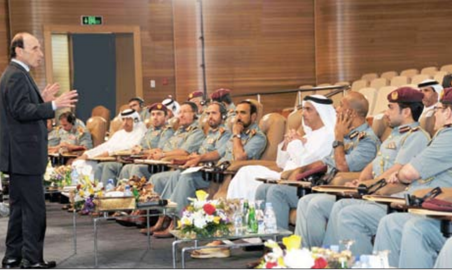
ومجموعة من التشخيصات لمعالجة الضغوط الأساسية بما يساهم في إحداث التغيير الكبير والمنتظم وفق أفضل الممارسات في مجال إعداد قيادات المستقبل.

لمناقشة الاقتراحات المختلفة مثل إنشاء ودعم القيم وفهم العلاقة بين القيادة والسلطة وتطبيق وممارسة النفوذ وإدارة ديناميكية التغيير الفردية والمؤسسية وتطوير قيادات المستقبل من خلال طرح إطار للقيادة المتكيفة للمشاركين في قيادة التغيير. وأضاف أن البرنامج يساهم في تطوير قيم الفرد والمسؤولية الجماعية وإنشاء تعاون أكبر بين الإدارات من أجل رؤية أكبر في ديناميكيات النظام وتطوير منهجية مصممة على قيادة مبادرات وزارة الداخلية للتغيير