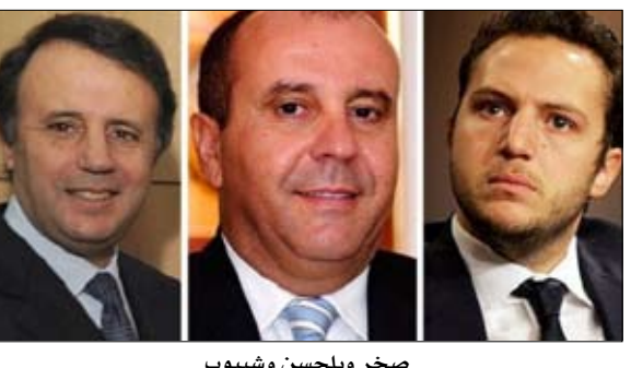
صخر وبالحسن وشيبوب

أوردت وكالة فرانس بريس أمس الثلاثاء أن المحكمة الأوروبية ألغت العقوبات الملقاة على الرئيس السابق زين العابدين بن علي والمشتبه به تورطهم في جريمة تهب الأموال العمومية و من بينهم أصهاره سليم شيبوب وصخر المطايري وبالحسن الطرابلسي. وقالت الوكالة إن محكمة الاتحاد الأوروبي خلصت في ثلاثة قرارات مختلفة إلى أن قرار تنفيذ العقوبات الذي اتخذته الاتحاد الأوروبي بعد شهر من الثورة التونسية، فرض على رجال الأعمال الثلاثة تجديدهم أرصدتهم لأنهم كانوا موضوع تحقيق قضائي تجريه السلطات التونسية حول خطوات تمت في إطار عمليات تبييض أموال. وذكرت المحكمة أن تعبير تبييض أموال لم يرد في الحكم الأول، ولم يتبين للاتحاد الأوروبي أن في الإمكان وصف شخص، طبقا لقانون العقوبات التونسي بأنه "مسؤول عن اختلاس أموال عامة" فقط بسبب خضوعه لتحقيق قضائي حول أفعال تتعلق بتبييض أموال. لكن المحكمة أوضحت أن قرارها سيقى ساري المفعول إلى حين انتهاء مهلة تقديم طعن محتمل ضد الأحكام الثلاثة التي صدرت أمس الثلاثاء.